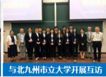
与北九州市立大学开展互访