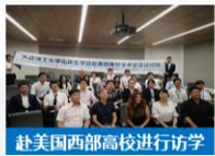
赴美国西部高校进行访学

国际交流项目数量 多 国际交流项目面向专业 广 选拔机制 新 访问学校知名度 高 资助力度 大