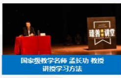
国家级教学名师 孟长功 教授 讲授学习方法