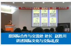
原国际合作与交流处处长 赵胜利 讲述国际文化与交际礼仪