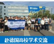
赴德国高校学术交流