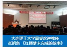
大连理工大学最受欢迎教师 嵇旭泉 《红楼梦未完成的故事》