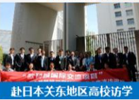
赴日本关东地区高校访学