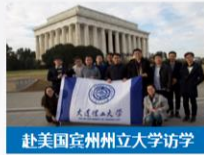
赴美国宾州州立大学访学

学院每年开展多样的 国际化 交流项目，赴美国、澳大利亚、日本、德国等地开展交流访学，提升学生国际化视野。学院目前拥有盘锦瑞德海外交流项目、爱华海外交流项目、欧科膜国际交流项目等成熟的国际交流线路 7支 ，项目数量位居全校 首位 。