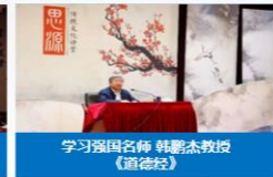
学习强国名师 韩静杰教授 《道德经》