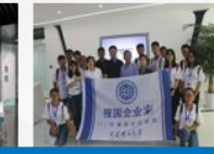
每年走访新企业，如陶氏化学、欧莱雅（中国）、昆仑能源等，开拓就业职场