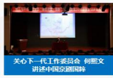
关心下一代工作委员会 何 Wentan 讲述中国京剧国际