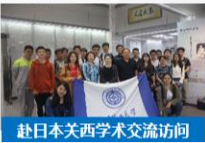
赴日本关西学术交流访问