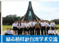
励志榜样赴台湾学术交流