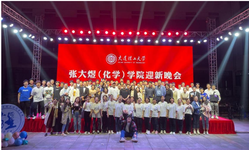
金秋九月，追梦大工，张煜学院全体师生期待着你相“煜”！