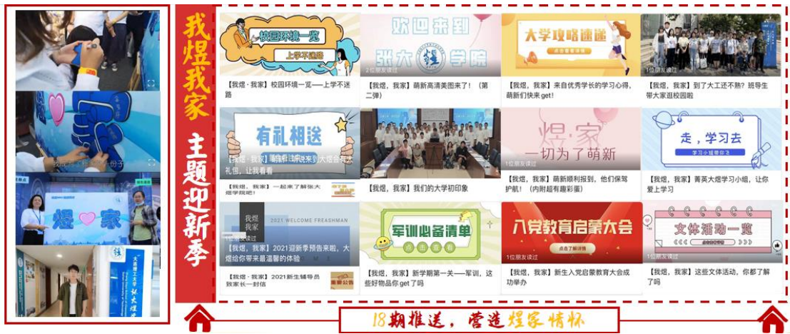
18期推送，营造煜家情怀