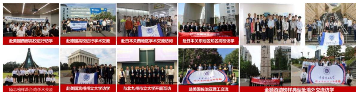
海外交流项目众多

学院目前拥有盘锦瑞德海外交流项目、爱华海外交流项目、欧科膜国际交流项目等成熟的出国（境）交流线路7支。资助4类优秀学生典型，让学生增强自信、开拓视野。