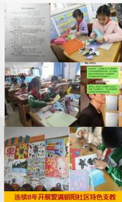
连续8年开展爱满朝阳社区特色支教