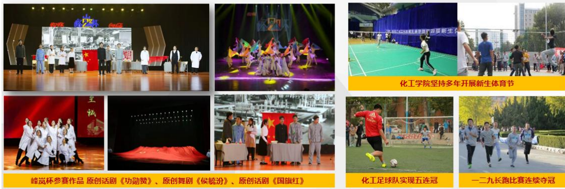
峰岚杯参赛作品 原创话剧《功勋赞》、原创舞剧《侯毓汾》、原创话剧《国旗红》

主打校园红色基因传承 原创文化 ，挖掘创校、建系功勋教师事迹，学生自编舞剧、话剧。开展“ 体育健身计划 ”，增强学生体质。