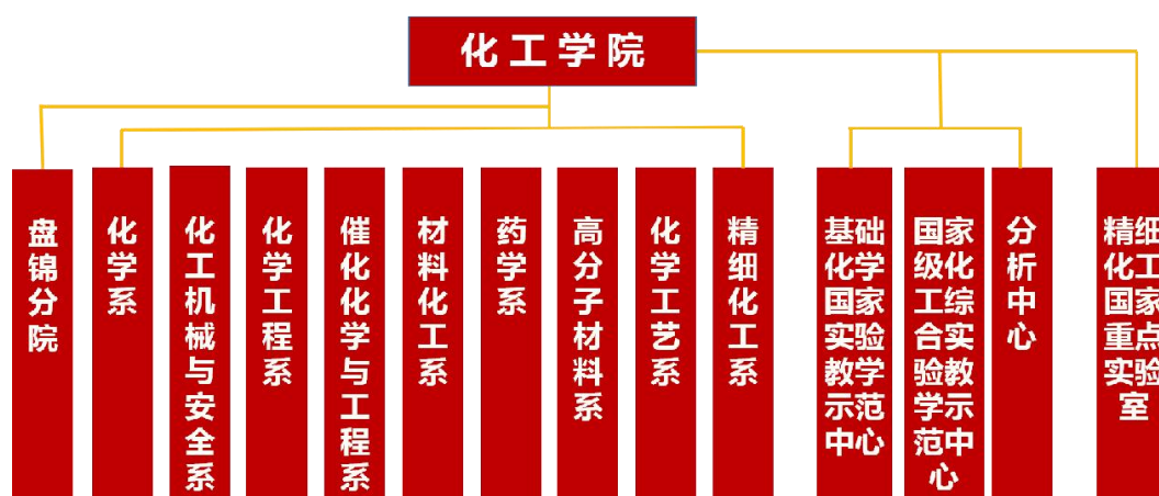
化工学院体系架构

化工学院下设 9 系、1 分院、3 个中心、1 个国家重点实验室。2022 年，化工学院获批教育部智能材料化工前沿科学中心。学院科学研究和人才培养已从传统化工优势领域，拓展到智能材料、先进能源、安全工程、生物医学等新兴高新技术领域，取得了令人瞩目的成就。化工学院建设有国内一流的化学、化工学科群，拥有 2 个“双一流”建设重点学科——化学和工程学；有一级学科国家重点学科 1 个、二级学科 5 个；省重点学科一级学科 2 个、二级学科 11 个；19 个二级学科博士点和 22 个硕士点，3 个博士后流动站。