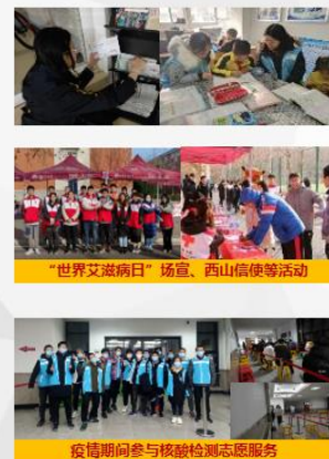
“世界艾滋病日”场宣、西山信使等活动