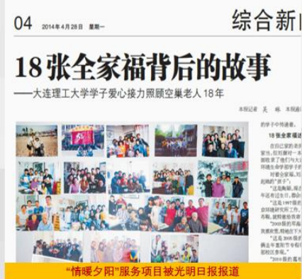
“情暖夕阳”服务项目被光明日报报道

“奉献”是长久以来根植于化工学子心中不变的坚守。学院“ 情暖夕阳 ”志愿服务队二十余载情牵退休老教师的故事被 《光明日报》 等主流媒体争相报道，且连续多年获得 省市和校级奖励 。每年，均有 千名 化工学子活跃于志愿服务、社区挂职、义务献血活动中。